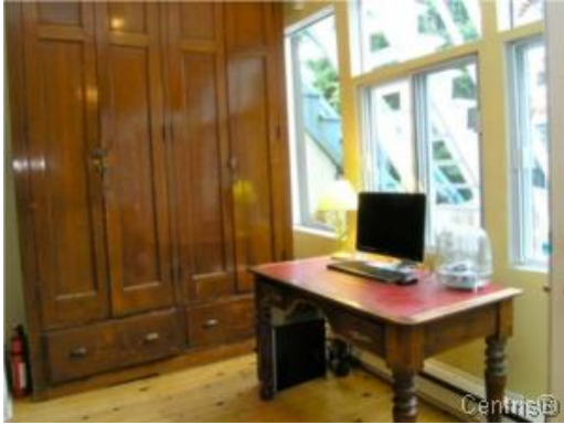
Bureau à domicile