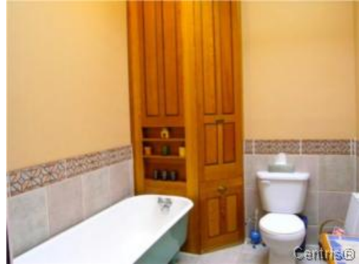
Salle de couture